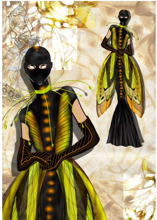
NOCTURN , ilustrații, 2024, tehnică digitală, 50x70 cm