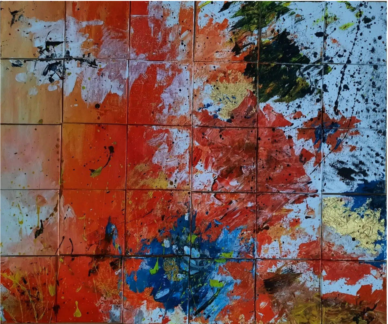
EXPLOZIE , Expoziția be**pArt în Italia la atelierul Montez 2022, tehnică mixtă, 50x50cm