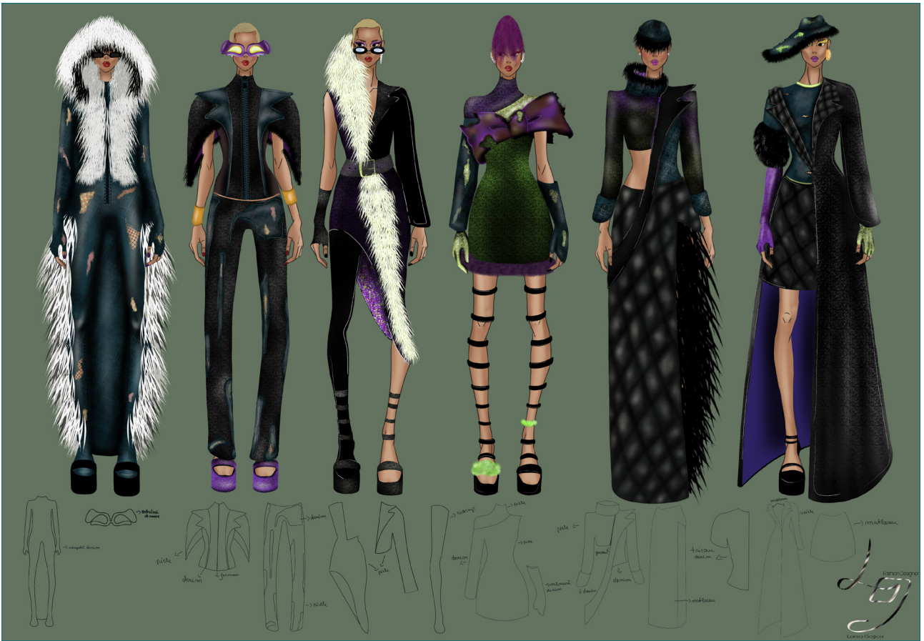
SHADOW OF THE RICH , 2023, tehnică digitală, 100x70 cm