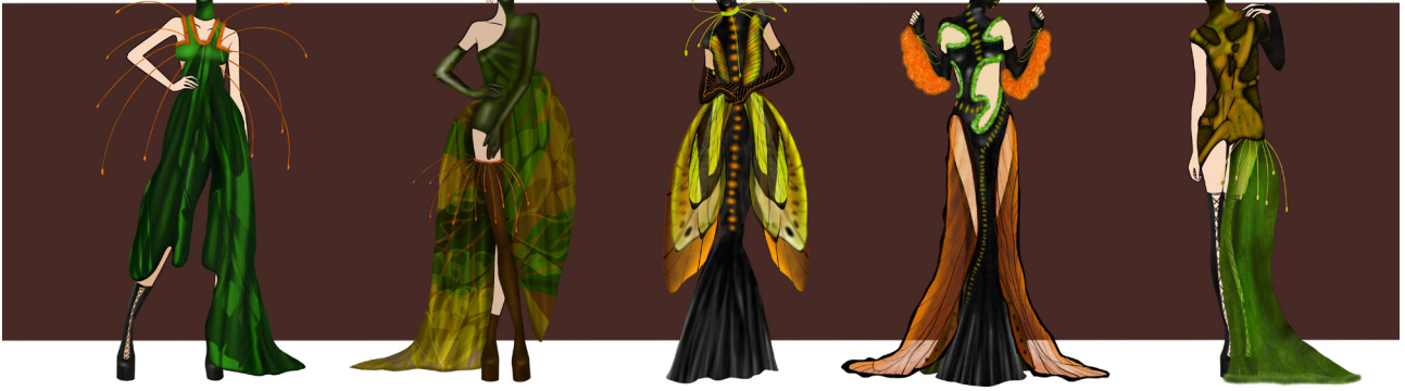
NOCTURN , 2024, tehnică digitală, 50x70 cm