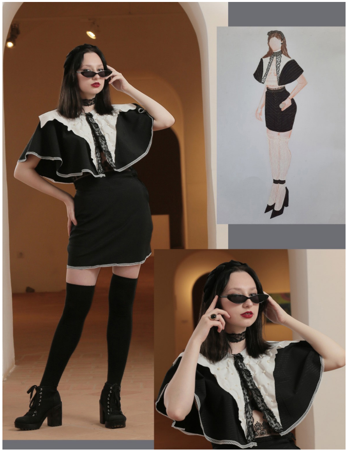
PICNIC AT HANGING ROCK , atestat, 2021