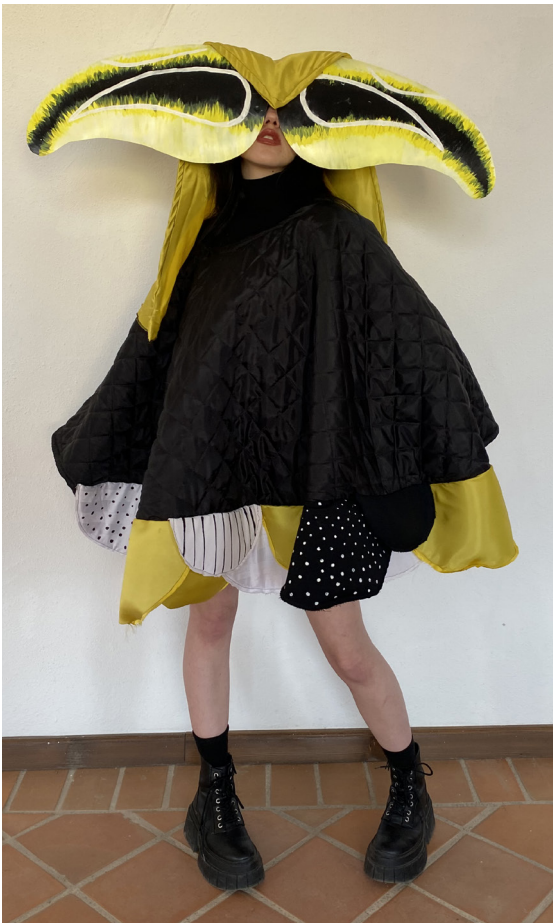
Colecția INSECT METAMORPHOSIS , lucrare transpusă