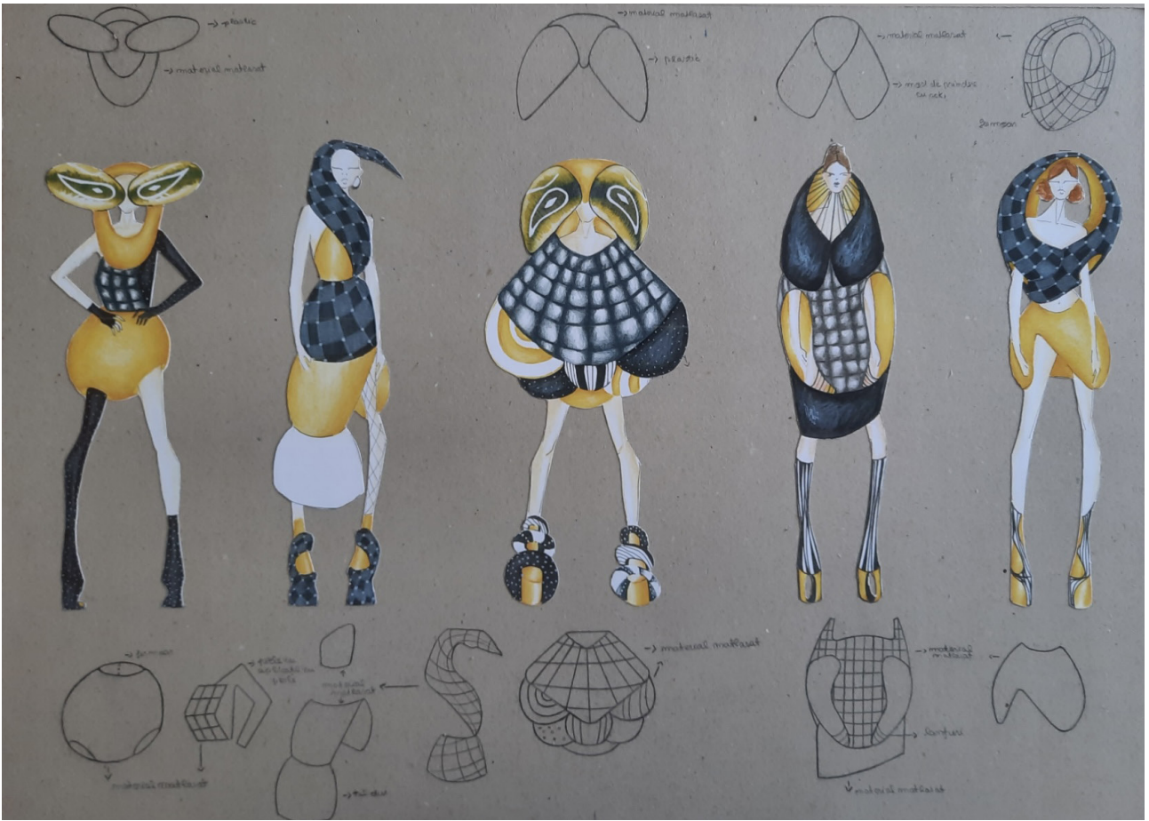
INSECT METAMORPHOSIS , 2022, creion pe carton, 50x70cm