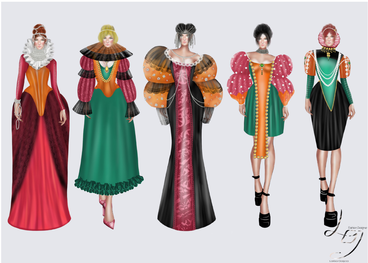
THE TRANDY PEARL , 2023, tehnică digitală, 100x70 cm